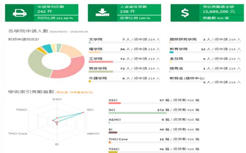
圖 3-1：教師研究獎勵申請案簡易統計分析