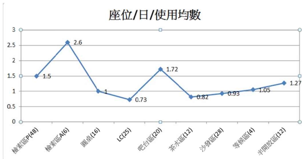
圖 3-4：總館 3 樓各區每個座位每天的平均使用次數