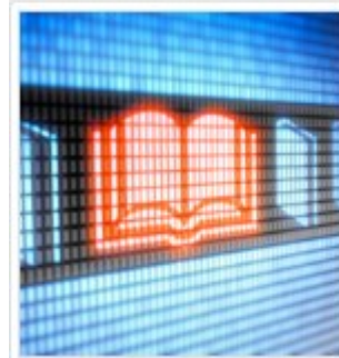
Library Views圖 書館觀點 @libraryview