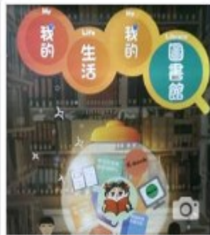
中華民國圖書館 學會 建立粉絲專頁的用戶名稱