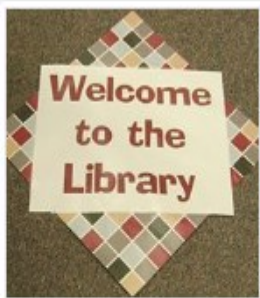
Library x Thinking 圖書館 思考 @libraryxthinking