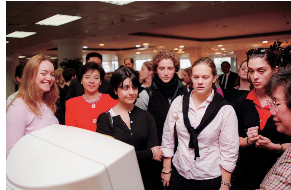
在淡江大學研習的外籍學生

是面對整個國家、整個世界」。而我淡江從創校開始即以「浩浩淡江，萬里通航（空間），新舊思想，輪來相將（時間）」自許；以創新中華文化，促進中外交流，躋身世界一流學府，參與世界學術創造為奮鬥目標，而恪盡大學對整個中國、整個世界的責任！