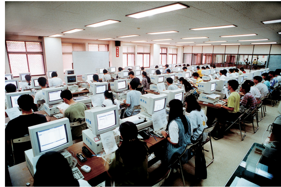
本校電腦教室一隅

五十四年，我在美國參加由季辛吉在哈佛大學主持的國際研究會，第一次聽到未來學這個字，也第一次在麻省理工學院看到了電腦，就如十幾年前第一次赴美，我又問出了「What is a computer?」，但這一次，電腦驚人的威力（以當時而言）讓我印象深刻，以後二十年便一直注意它的發展，也可以說，對資訊學，我啓蒙得很早。五十八年，我再度赴母校伊利諾大學攻讀博士，由於學校正好有CAI這方面的研究，使我首度體會到電腦的應用。一年後，因母喪回國，隔了幾年再出國念書，那時候整天泡在終端機旁，學習精神一點不輸二十來歲的年輕學生，若說我對