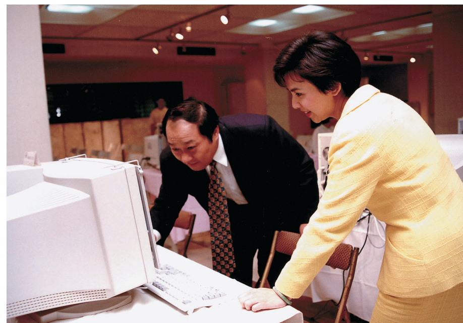
張校長與張副校長參觀資訊展示會

在這充滿新希望與期待的淡江S形曲線裡，淡江人要堅定意志，把握方向，薪火相傳，克服所有的困難，把四十五週年校慶日作為淡江新S形曲線的起點，在未來的五年裡，大家團結在一起，相互扶持、同舟共濟駛向光明的廿一世紀彼岸，再造淡江的高