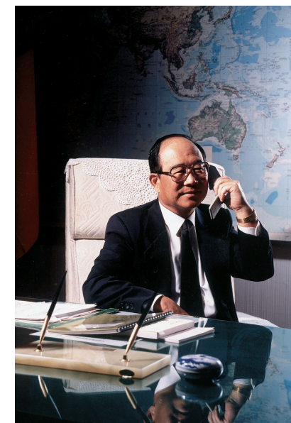
張先生出掌交通部長

張建邦先生認為，「部長不必是專才，重要的是會用專業人才。」為此，他很注意提高員工的士氣。在他上任後開出的第一張支票是——明年三月選出的郵政人員，除了照往例有獎金、獎狀外，外加出國考察一週以為鼓勵。張先生說：「對基層人員應有實質的鼓勵，才能完全發揮『獎』的功效。」對於高層幹部，張先生則鼓勵他們培養世界觀，多參加國際會議和加強在職訓練。「員工福利和進修的錢是不能省的，」張先生說。在這原則