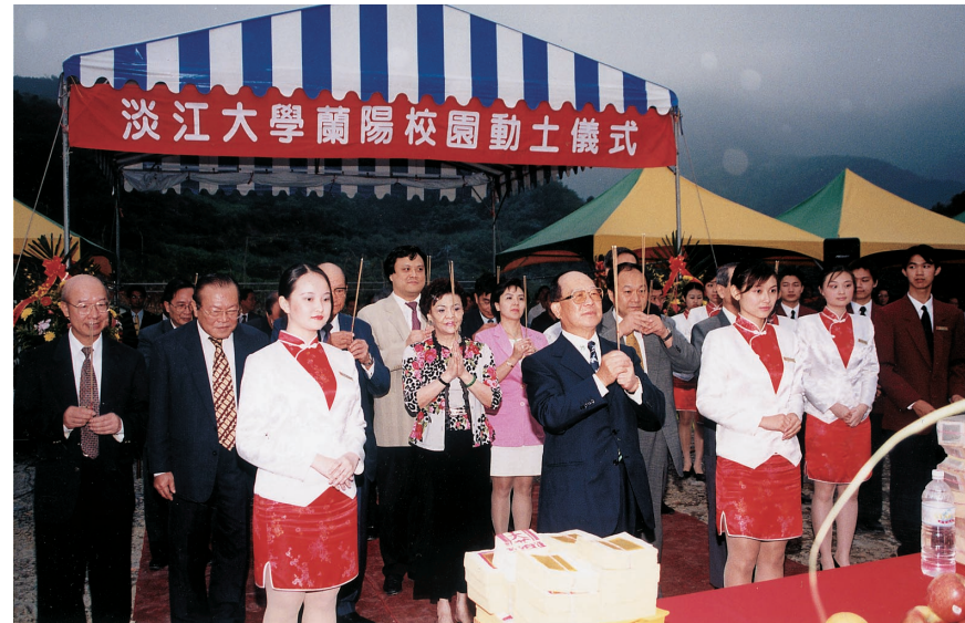
蘭陽校園動土儀式

特色和發展潛力之優良系所，給予獎助，使其師生有更多機會和預算從事教學、研究與出版，除了提升其系所學術聲望外，也希望因此帶動其他系所見賢思齊，為學校塑造良好的研究風氣，這是現在我們努力的方向，希望十年二十年之後，淡江能擁有國際聲望。