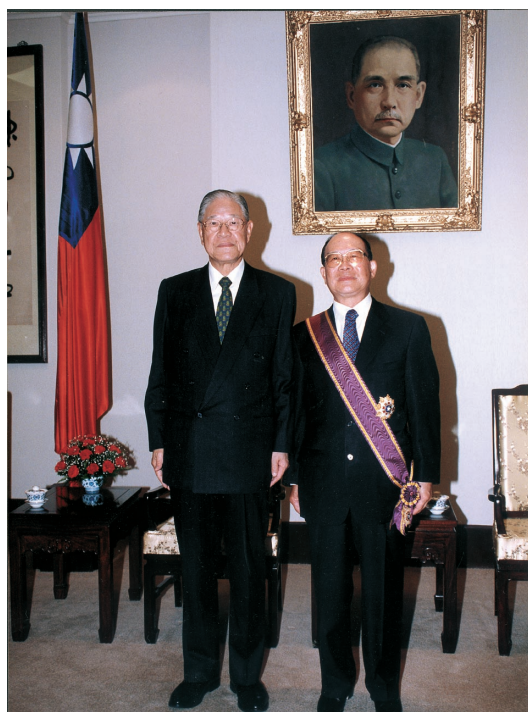
李總統親授景星勳章

員奉行國際化、資訊化、未來化工作多年，因此我們完全支持總統民主化、國際化、科技化的改革理念。同時，張先生也特別強調，感謝李總統自本校創校以來，持續不斷的愛護，因為李總統曾親自蒞臨淡江七次之多，對淡江大學以及高等教育之重視於此可見。其實張先生的榮譽與淡江大學之成長是血脈相連的，張先生獲此殊榮之時，也正逢本校即將邁入創校五十週年之際。張先生於接受贈勳之後，即接受「淡江時報」的專訪。更顯現，他對淡江大學的期許與情懷。這一段採訪不僅是張先生獲此殊榮後的感想，也正是他帶領淡江師生曾經走過的奮進過程。我們把這段訪問對話中的若干頗富意義的文字，轉錄於下：